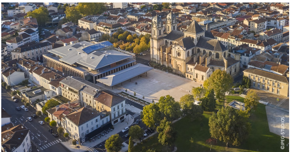
▲ Vue aérienne de la place des Halles dans la ville

Destinées à concentrer et à valoriser l'offre des produits du terroir, les circuits courts, le bio, les savoir-faire artisanaux, tout en offrant au consommateur de nouveaux modes de distribution et un lieu convivial, les nouvelles halles constituent un moteur de la revitalisation du centre-ville.