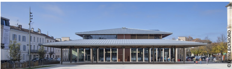
▲ Vue sur la toiture en zinc

La rénovation imaginée en 2018 vise à redonner une identité aux nouvelles halles. Une toiture à 4 pentes à larges débords qui vient coiffer le bâtiment avec une charpente en bois simplifiée rapportée sur le toit plat de l'ancienne toiture. Une couverture en zinc recouvre l'ensemble, en harmonie avec la cathédrale située à proximité.