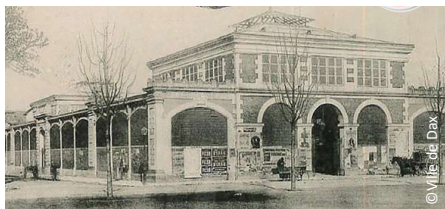
▲ Les halles en 1872

Les premières halles de Dax ont ouvert en 1872. Elles ont bénéficié de plusieurs restaurations jusqu'à leur destruction partielle dans un incendie en 1979. L'architecture du nouveau bâtiment livré en 1985 différait complètement de celle du précédent, uniforme sur ses 4 façades et sans lien avec son contexte urbain.