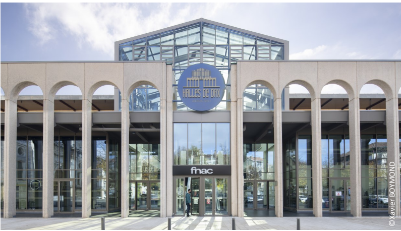
▲ Vue sur la verrière centrale

En référence aux halles du XIXème siècle, une verrière couvre la travée centrale. Sur le versant sud, elle est en continuité de la pente de toiture. Sur le versant nord, elle forme comme un chien assis de verre réglable permettant une régulation de la ventilation été comme hiver. L'avancée vitrée visible de loin, signale l'activité et l'entrée principale de la halle.