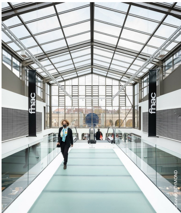
▲ Vue sur la verrière centrale depuis l'étage du marché couvert