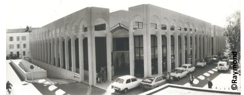
▲ Les halles en 1985