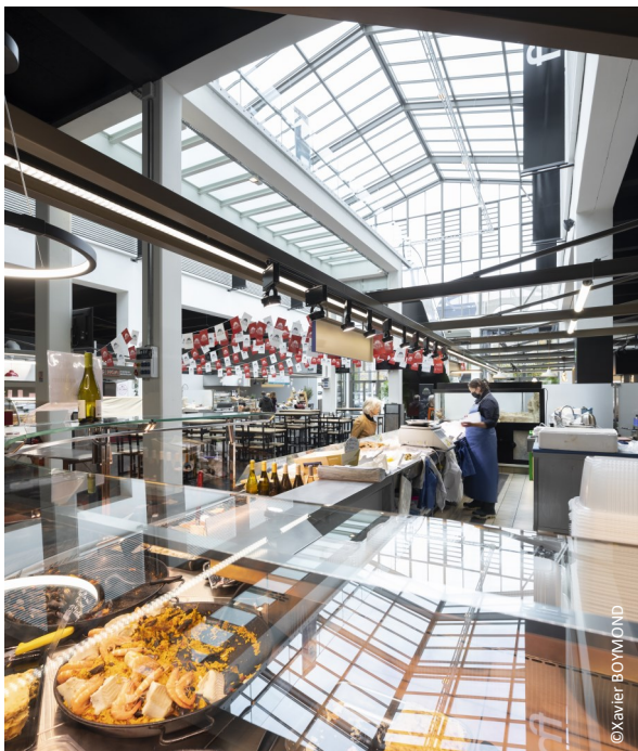
▲ Vue sur la verrière centrale depuis le RDC du marché couvert

Les étals sont répartis sur les deux espaces centraux, adossés à un bloc composé des locaux de stockage des denrées et des chambres froides. Les étals modulaires sont composés sur la même base structurale. Un socle d'une douzaine de centimètres surélève le commerce par rapport aux circulations.